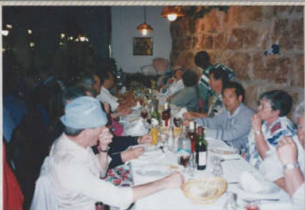
Abdinneressen auf Mallorca