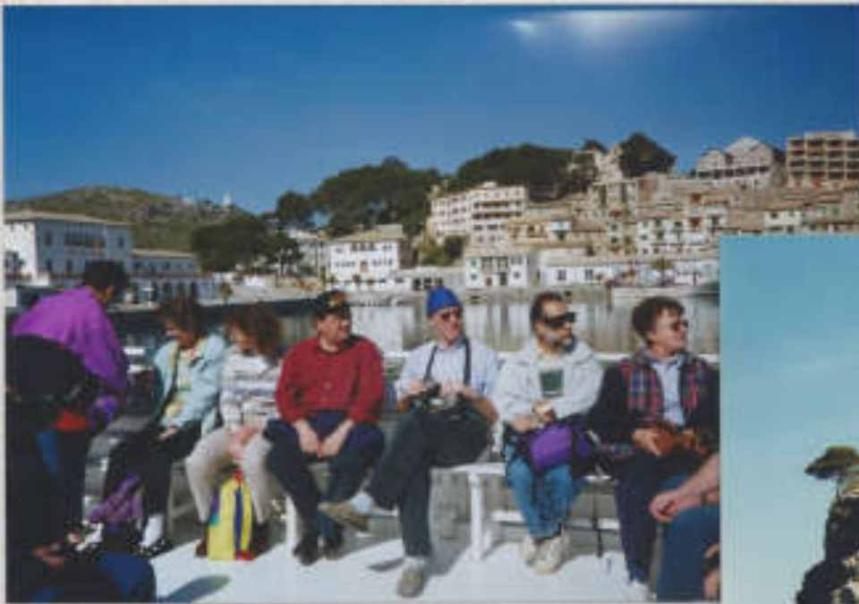
Küstenfahrt nach La Calotza