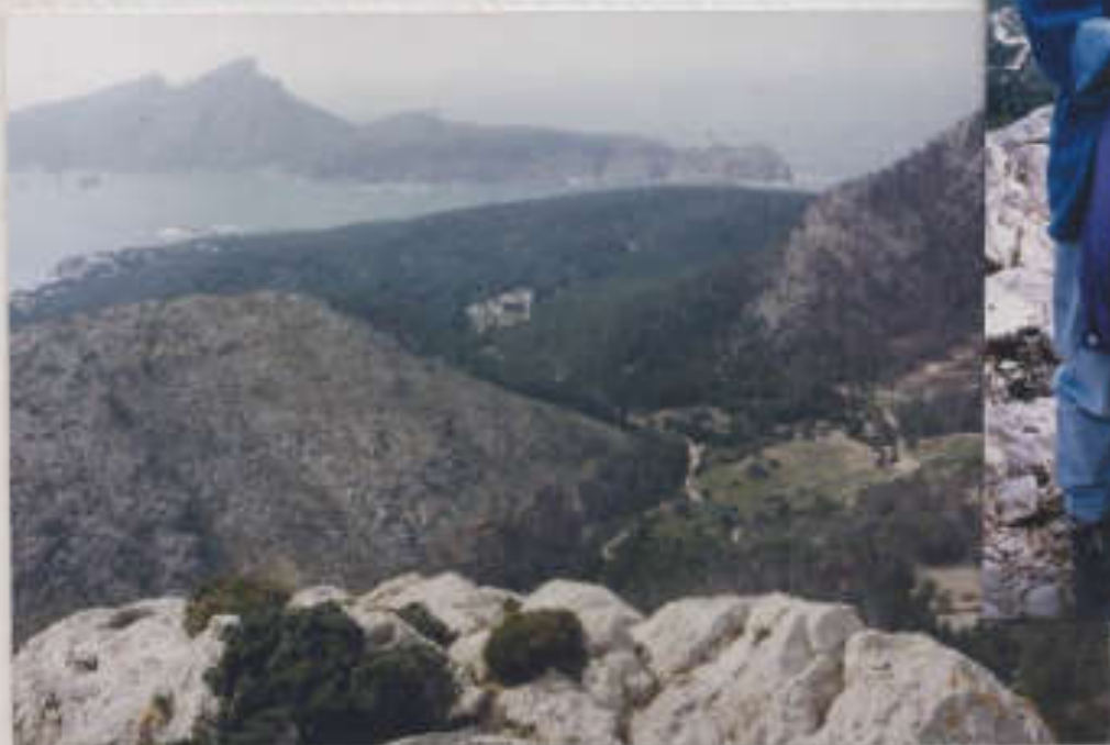
Blick zur Insel Dragonera (Drake)