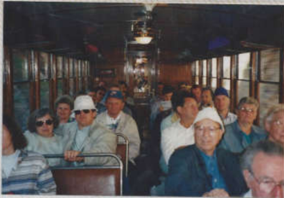
Historische Eisenbahnfahrt nach Gales