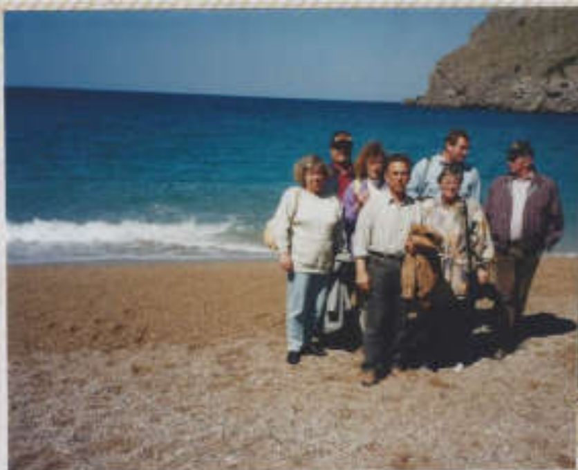
Torrent de Pissis (sine fusarierende schlucht)