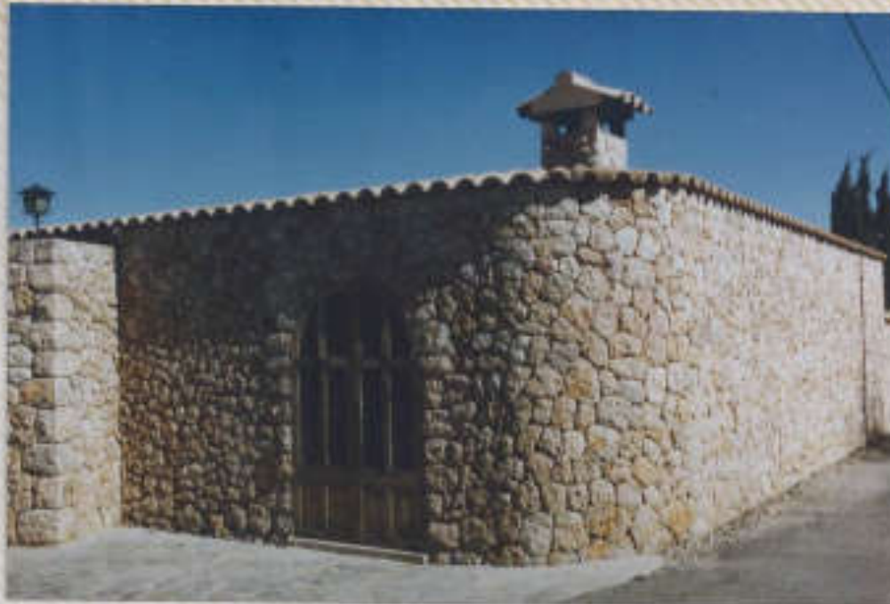
Eine von 34.000 km Trockenmauern