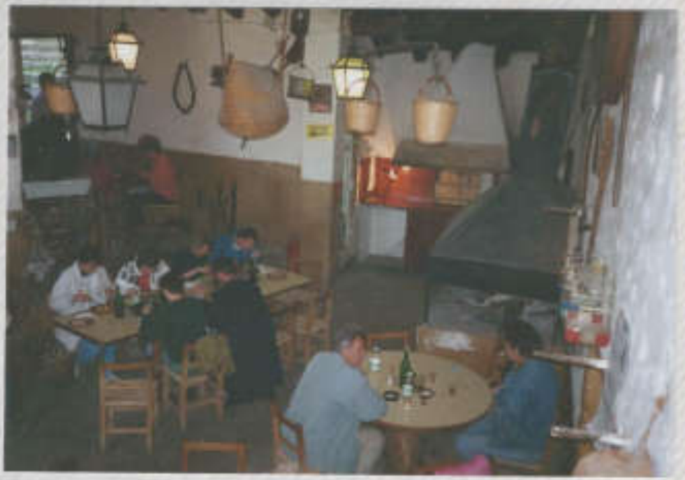
Fröhliche Einkehr in der Finca