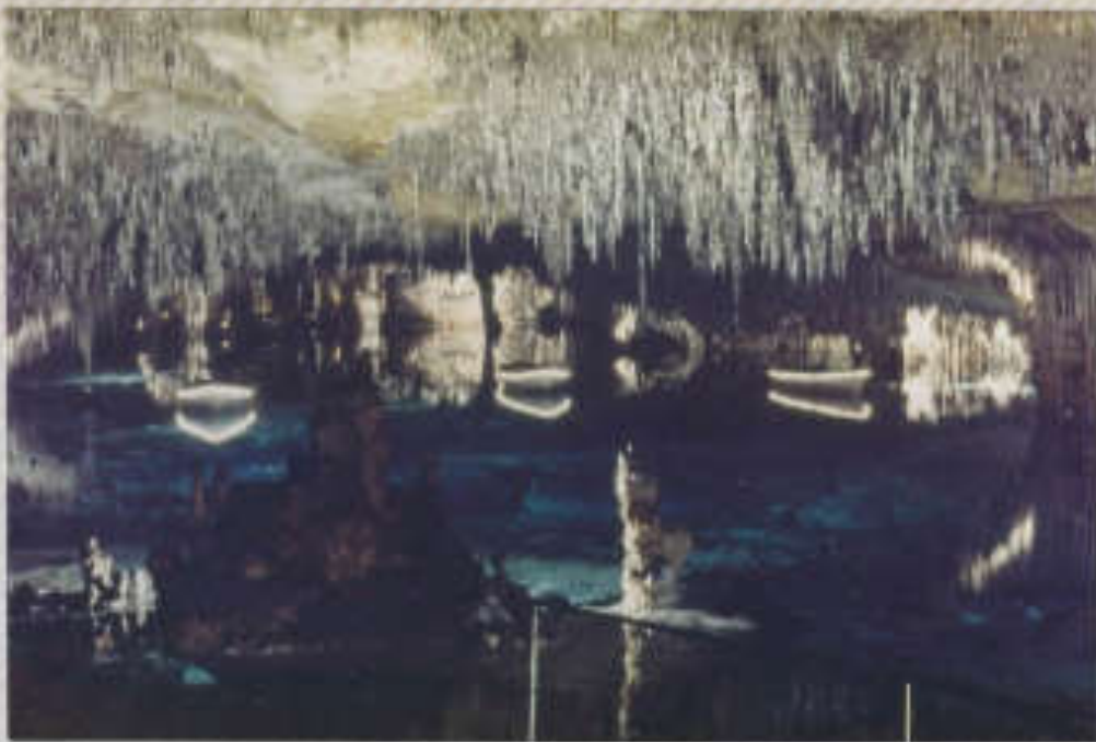
Drachenhöhle Patio Cristo