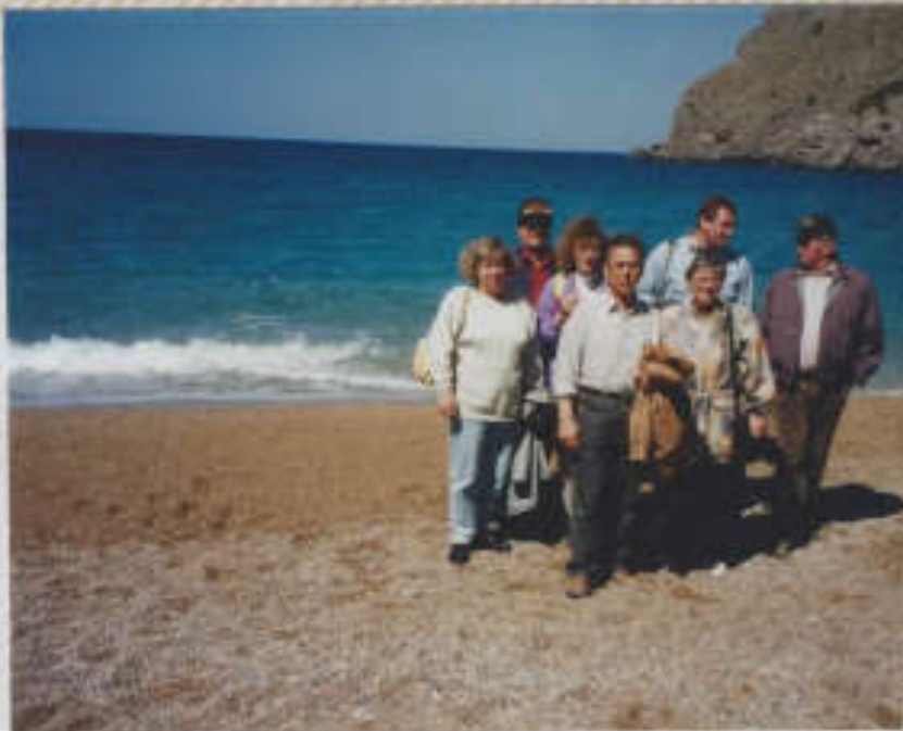
Torrent de Paris (am fanzinierpud sich wut)