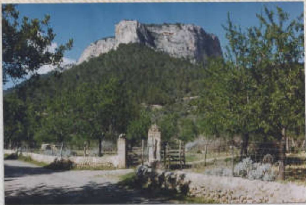
Treppe zum Castillo de Aro