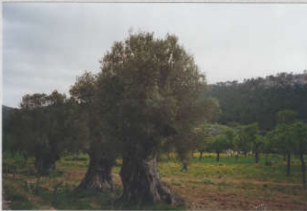
2000 Jahre alte Olivenbäume